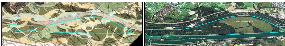
Carte de 1838 avec pourtour actuel (bleu) et photo aérienne récente de l'île du Rhin.

En fonction des objectifs écologiques, de la nouvelle topographie, et de campagnes faune et flore sur le terrain, divers milieux naturels ont été envisagés et des listes de plantes (herbacées et ligneuses) ont été établies en conformité avec la station, l'indigénat et la sociabilité des composantes.